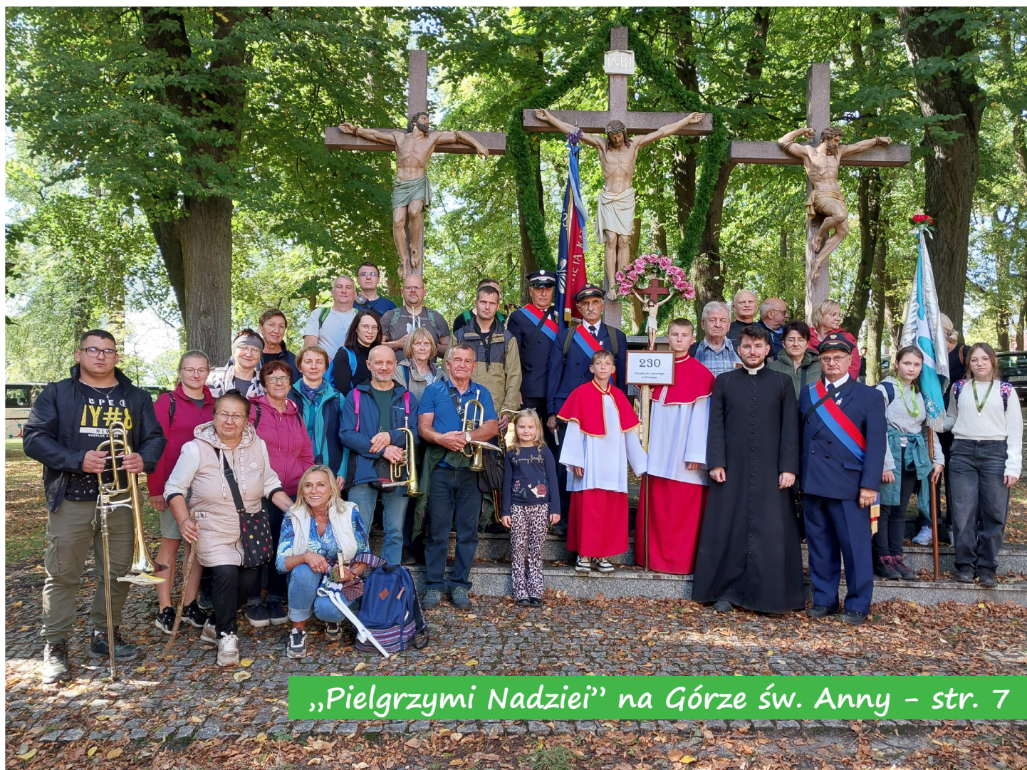
„Pielgrzymi Nadziei” na Górze św. Anny – str. 7