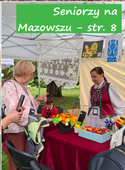
Seniorzy na Mazowszu – str. 8

Co jeszcze w numerze: Sukces OSP Świniowice – str. 8 Karczma Piwna – str. 3 Zrozumieć psa – str. 6 Zagadkowe zgony w cieniu pałacu księcia Hohenlohe – str. 4