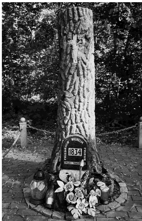
Pomnik ustawiony w miejscu tragicznej śmierci Friedricha Wilhelma Prieura.

Książe Adolf miał opinię czło- wieka surowego, wręcz despotycznego - zarówno wobec poddanych, jak i urzęd- ników czy członków własnej rodziny (o czym więcej w kolejnej części cyklu). Czy byłby jednak zdolny do zlecenia za- bójstwa? Tego nie wiemy.