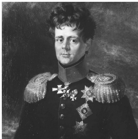
Książę Eugene von Württemberg z Pokoju

skiego narodu niemieckiego, Franciszka II Habsburga. Sam książę Eugen służył jako generał piechoty w armii rosyjskiej. Po ojcu odziedziczył fideikomis Carlsruhe (Pokój na Górnym Śląsku, dziś w woj. opolskim, pow. namysłowski), gdzie zmarł w 1857 roku.