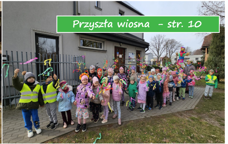
Przyszła wiosna - str. 10