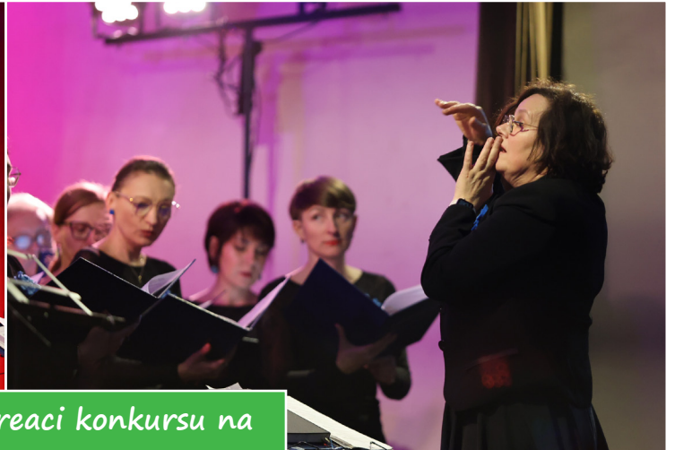
Chór Fresco i laureaci konkursu na kartkę wielkanocną - str. 7