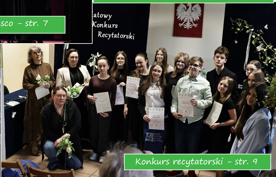
Konkurs recytatorski - str. 9