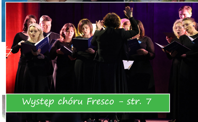
Występ chóru Fresco - str. 7