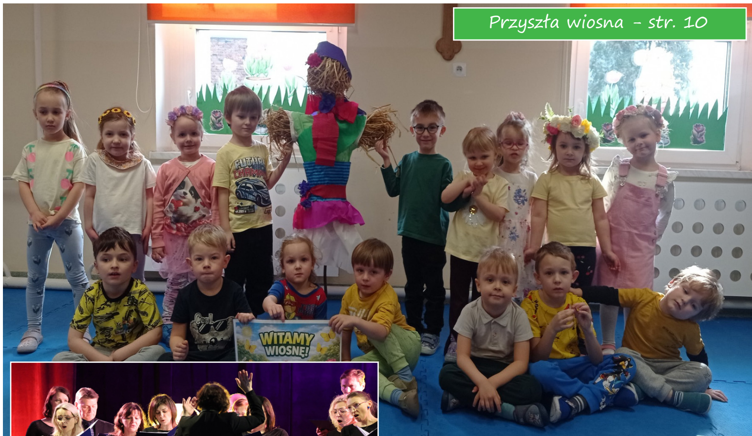
Przyszła wiosna - str. 10