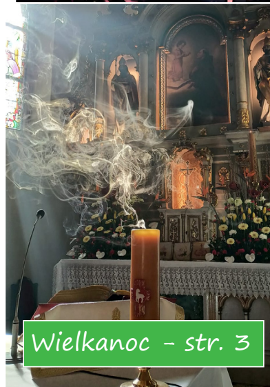
Wielkanoc - str. 3