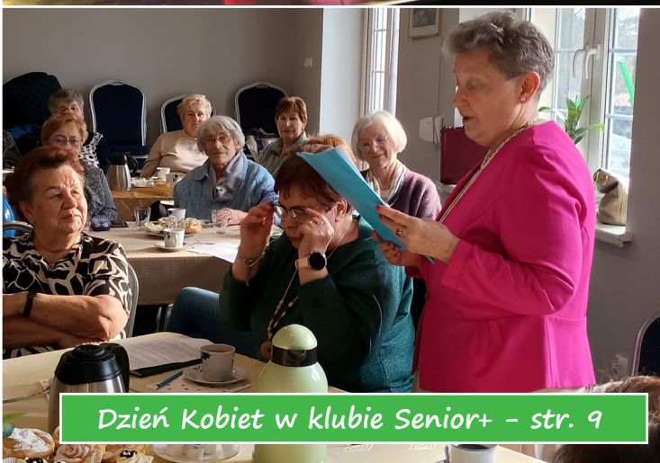
Dzień Kobiet w klubie Senior+ - str. 9