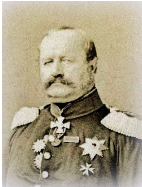
Książę Adolf zu Hohenlohe-Ingelfingen

Kolejnym wyrazem zaufania Wilhelma Hohenzollerna wobec Pana Tworoga i Koszęcina było powierzenie mu funkcji premiera Prus. Stało się to w marcu 1862 roku podczas trwania w Prusach kryzysu konstytucyjnego. Król, chcący przeprowadzić reformę wojska pruskiego, potrzebował na to zgody parlamentu, w którym dominowali posłowie liberalni sprzeciwiający się reformie. Wilhelm I miał nadzieję, że to właśnie rząd utworzony przez konserwatywnego księcia z Koszęcina przekona liberalnych posłów parlamentu i przeprowadzi do końca reformę wojska.