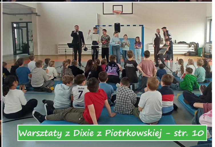
Warsztaty z Dixie z Piotrkowskiej - str. 10