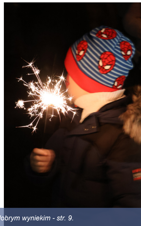
Foto. Finał WOŚP 2025 - Sztab w Tworogu znów może się pochwalić dobrym wynikiem - str. 9.