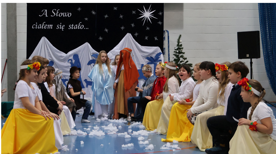
Foto. Zdj. powyżej - Rodzinne Kolędownie w Boruszowicach. Więcej na ten temat na str. 6.