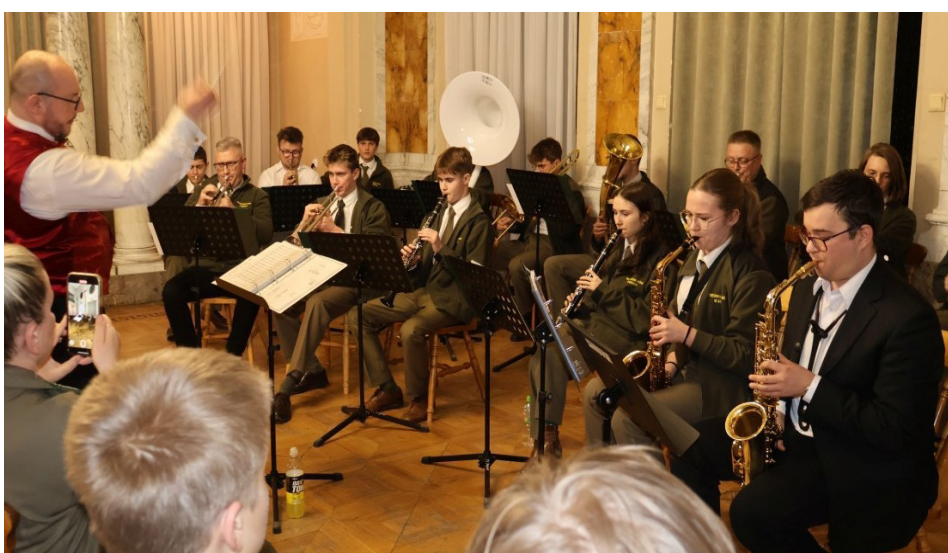
Foto. Rozpoczęło się z przytupem utworem z repertuaru Ozzy'ego Osbourne'a „Crazy Train”, ale znalazło się także conieco dla miłośników świątecznych, jeszcze bożonarodzeniowych, klimatów. 30 stycznia na sali reprezentacyjnej Pałacu w Brynku odbył się Noworoczny koncert Leśnej Orkiestry Koncertowej działającej przy Zespole Szkół Leśnych i Ekologicznych. Więcej informacji i fotek na twg-kurier.pl .