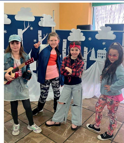
Foto. 6 lutego, z inicjatywy Samorządu Uczniowskiego uczniowie i nauczyciele z Zespołu Szkolno-Przedszkolnego w Wojsce przenieśli się w czasie, prosto do kolorowych lat 90. Było bardzo wesoło, barwnie i tanecznie. Prócz okazji do przebrania się w strój nawiązujący do dekady, dzień w stylu lat 90. umożliwił poznanie takich „nowinek” jak walkman czy kasetą magnetofonowa.