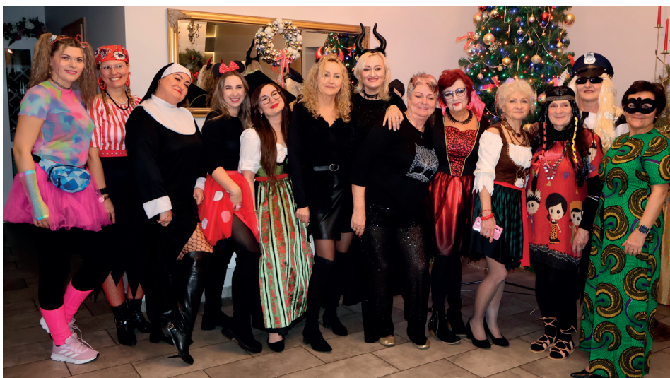
Foto. Babskie comby w Hanusku (zdz. powyżej) i Tworogu (zdz. poniżej) - o karnawałowych imprezach w wersji kobiecej i nie tylko na str. 7.