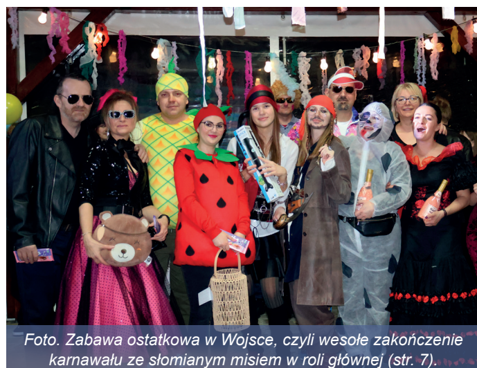
Foto. Zabawa ostatkowa w Wojsce, czyli wesołe zakończenie karnawału ze słomianym misiem w roli głównej (str. 7).