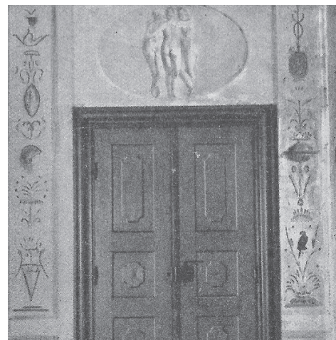
Foto. Originalne malowidła na ścianach pałacu w Tworogu (zdjęcia ze zbiorów Fryderyka Zgodzaja).

Ostatni właściciel Tworoga i Strzelce Opolskich z linii Colonnów zmarł w czasie kiedy po napaści Napoleona Bonaparte