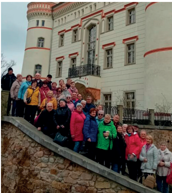
Foto. Tworogowscy emeryci postanowili przywitać wiosnę aktywnie. Wybrali się więc na wycieczkę do Karpacza, Cieplic i Jeleniej Góry. Relację z ich wyprawy znajdziecie na str. 4.