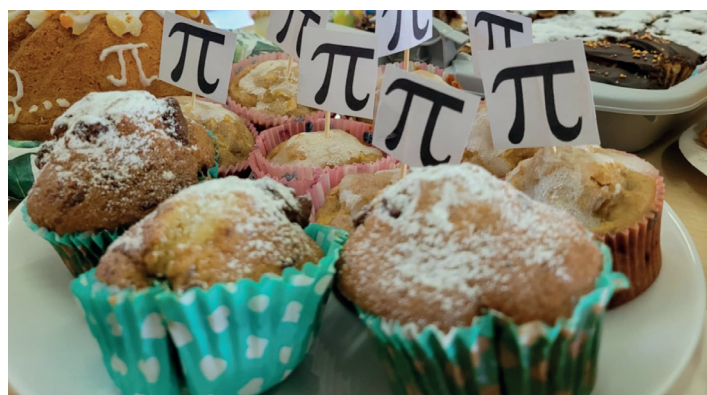
Foto. Matematykę da się lubić! W ZSP w Wojsce odbył się Dzień Liczby Pi. Wydarzenie miało na celu przybliżenie uczniom tej niezwykłej liczby oraz rozwijanie ich zainteresowań matematycznych w sposób kreatywny i zabawny (po więcej kadrow z życia naszej gminy zaglądnijcie na twg-kureir.pl).

Drukarnia FOTOIDRUK, ul. Fabryczna 26, 42-660 Kalety