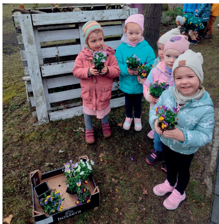
Foto. Prace w ogrodzie już trwają! Najmłodsze przedszkolaki z Boruszowic rozpoczęły sadzenie kwiatów oraz wysiew ziół i warzyw. Kilka zielonych nowości pojawiło się także na przedszkolnym parapecie. Dzieci hodują tam m.in. rzeżuchę i owies. „Ogródek na oknie” już niebawem będzie cieszyć zapachem i widokiem forsycji, bazi oraz zapachem ziół, żonkili, hiacyntów. – Wiosna w pełni zawitała do naszego przedszkola! – podsumowuje Pani Dorota (zdjęć szukajcie na twg-kurier.pl).