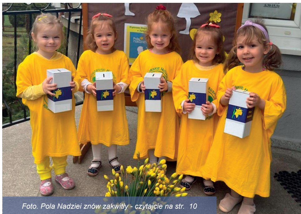
Foto. Pola Nadziei znów zakwitły - czytajcie na str. 10