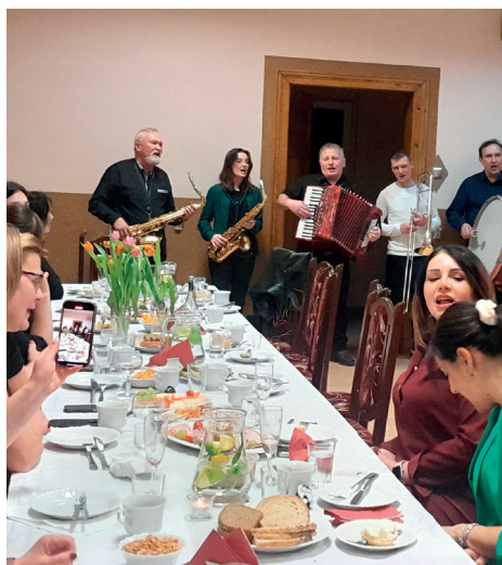
Foto. Dzień Kobiet w Wojsce (zdj. na samej górze), Połomi (pośrodku) oraz w Nowej Wsi Tworoskiej (na dole) - okazja do dobrej zabawy, do celebracji kobiecości i oddechu od mężczyzn... Mamy nadzieję, że tak spędzony czas pozostawił Paniom jedynie żal, że Dzień Kobiet nie zdarza się przynajmniej raz w miesiącu! Więcej na str. 4.